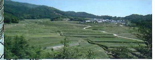
坂本棚田全景 南側の小山からの眺め