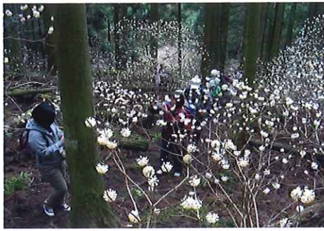
ミツマタの森へのウォーキング