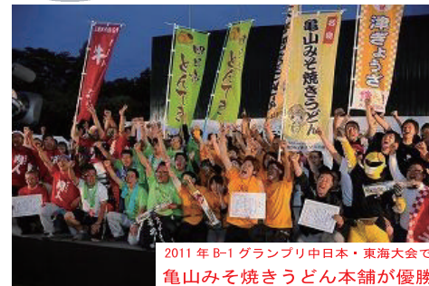
2011年B-1グランプリ中日本・東海大会で亀山みそ焼きうどん本舗が優勝

亀山みそ焼きうどんのPRキャラクター亀山の「かめ」とみそ焼きうどんの「み」とって名づけられた。亀山の味（み）の意味も込められている。